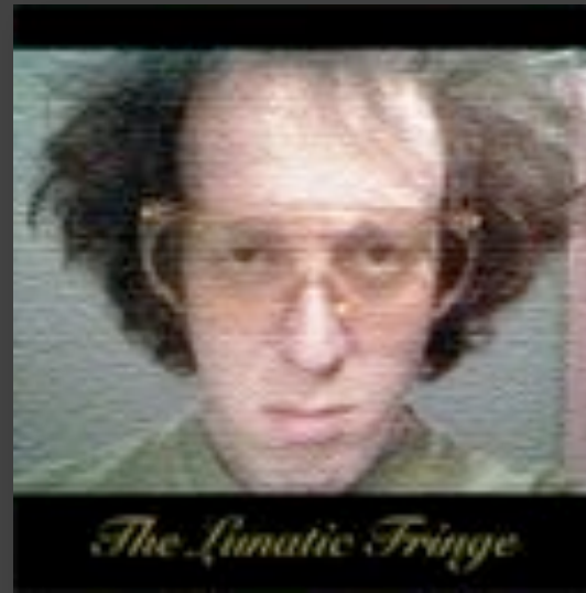
The Lunatic Fringe