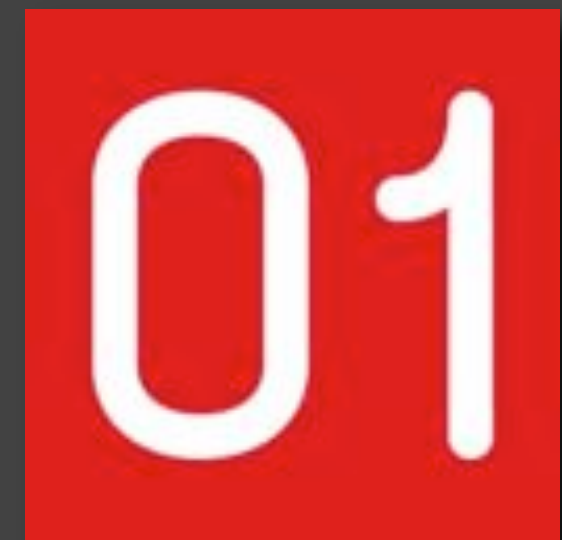
01 Blog Podcast